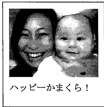
ハッピーかまくら!

昭和48年2月生まれ 0型 聖心女子大学文学部英文学科卒業 総務常任委員会・自治基本問題調査特別委員会・都市計画審議会所属 平成20年予算特別委員会委員長・前若手市議会議員の会関東ブロック 事務局長・民主党鎌倉市議会議員団所属